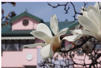
榛東中央こども園