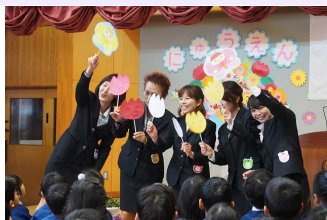
榛東南部こども園

子どもたちの笑顔は、何にも代えがたい宝物。この宝物を保護者や地域の方々と分かち合い、だれもが幸せになれるこども園・保育園を目指しています。