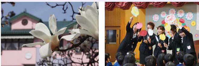
榛東中央こども園