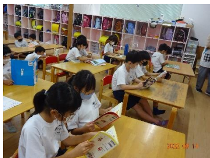
読書の時間。集中して読んでいます。