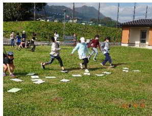
公園でみんなで絵合わせゲームを楽しみました