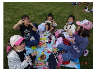
お弁当、いただきまーす♪